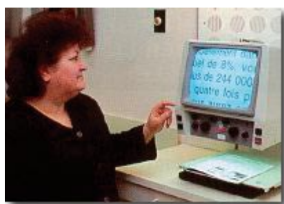
Figure 2 : exemple d'aide électronique à la lecture (extrait du site www.amoq.org )

Enfin des aides électroniques comme des systèmes de télévision en circuit fermé avec appareils grossissants et dispositifs de lecture informatisés intégrés sont utiles dans certaines circonstances (voir figure 2).